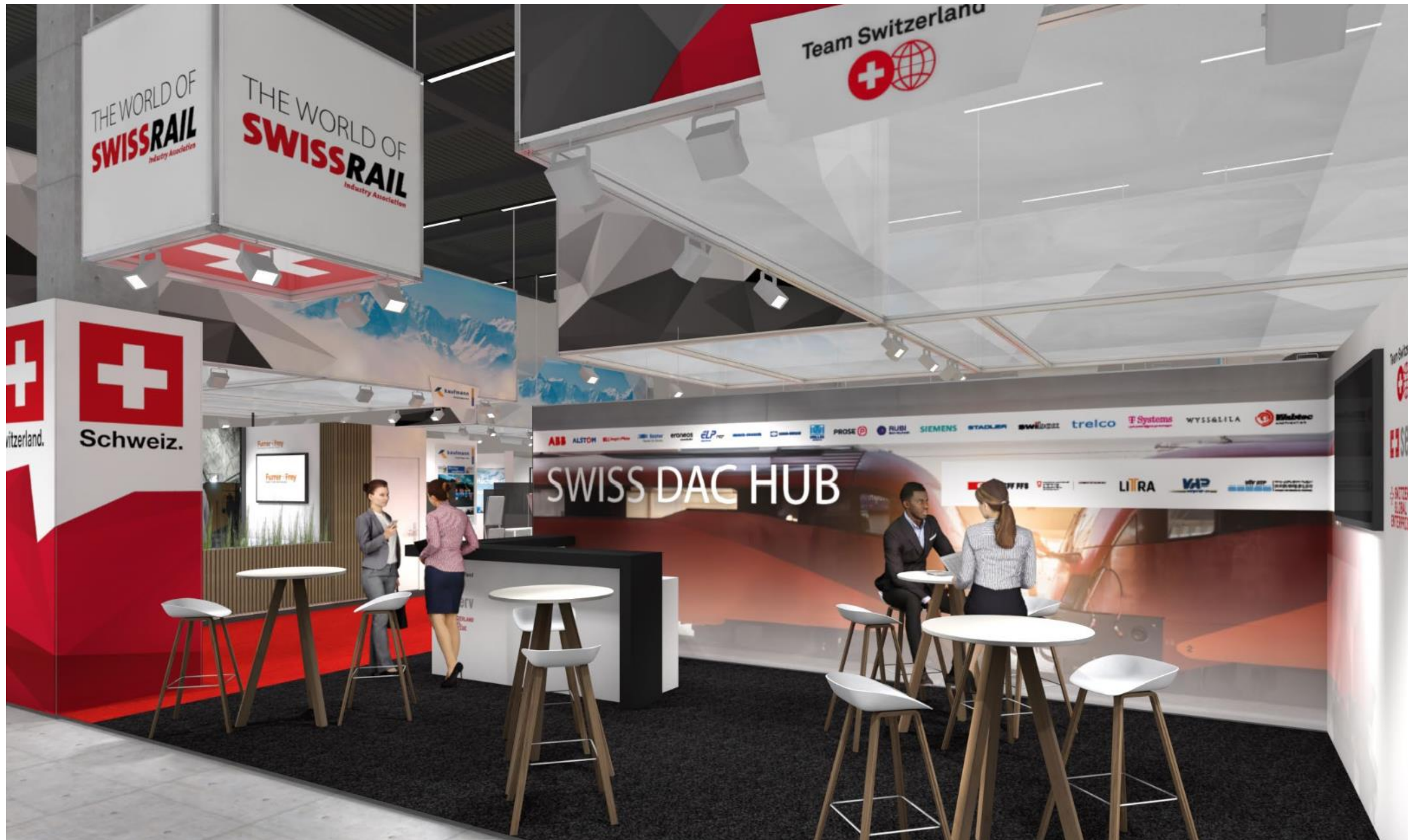
Visualisierung Swiss DAC Hub, Hug Standbau